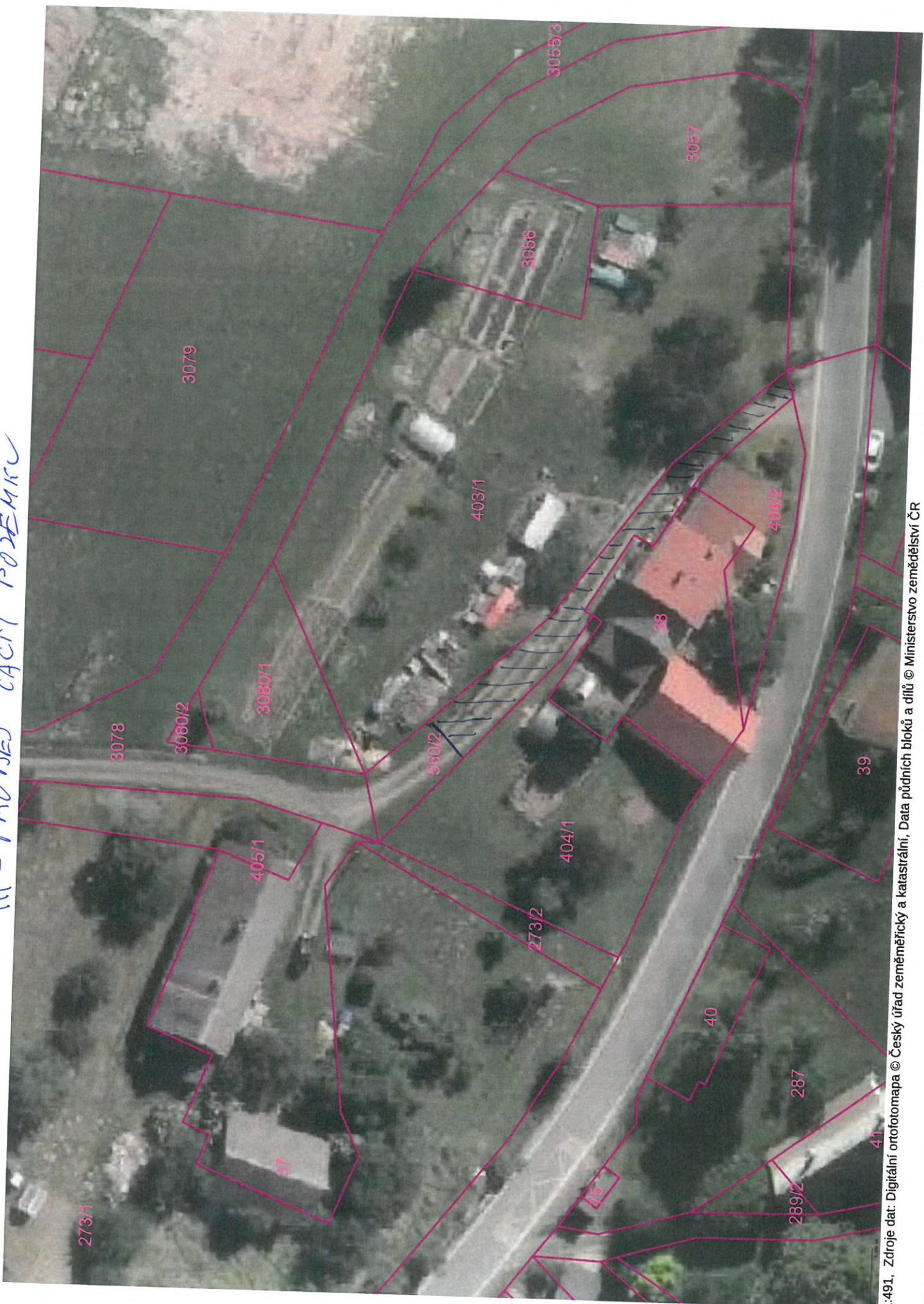
1:491. Zdroje dat: Digitální ortofotomapa © Český úřad zeměměřický a katastrální, Data půdních bloků a dílů © Ministerstvo zemědělství ČR